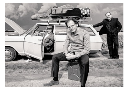
Das „Trio Hut Up“ spielt erstmals im Rumelner Kulturspielhaus.

Karten zum Stückpreis von 15 Euro gibt es im Vorverkauf online ( www.kulturtreff.events ) und in Rumeln bei Klatt Reisen & Shop (Dorfstraße 62d), Optik Peerebooms (Dorfstraße 63) und in der Apotheke „Am Geistfeld“ (Rathausallee 12-14), die Musikschule ist erreichbar unter ☎ 02151/404149. Obacht: Kaffee und Kuchen sind im Eintrittspreis nicht enthalten.