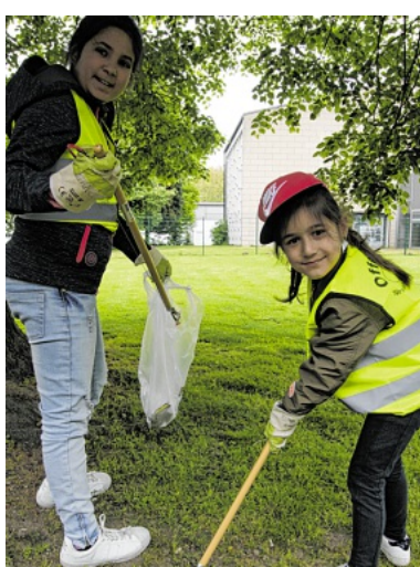
In Zweier-Teams machten sich die Kinder auf Sammeltour.

Hier treffen sich die Kinder regelmäßig in der ersten Wochenhälfte nach der Schule, um gemeinsam Hausaufgaben zu machen und ihre